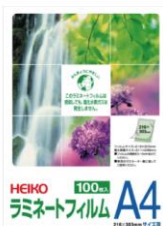
ラミネートフィルム