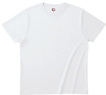
商品名 : ヘビーウェイトTシャツ GAT-500

URL : https://apparel.raksul.com/brands/truss