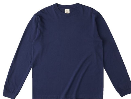
商品名 : オーガニックコットンロングスリーブTシャツ OGL-914