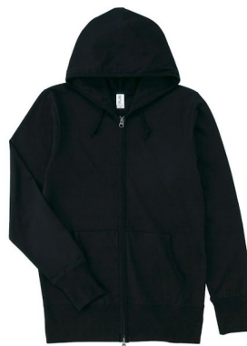
商品名 : ジャージージップパーカ SZP-111