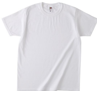
商品名: フルーツ オブ ザ ルームベーシックTシャツ J3930HD

URL: https://apparel.raksul.com/brands/fruit-of-the-loom