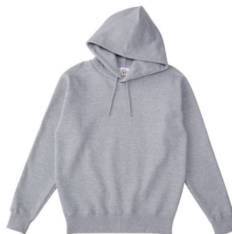
商品名: レギュラーウエイト ポケットレスパーカー SP2252