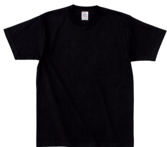
商品名: オープンエンドマックスウエイトTシャツ OE1116

URL: https://apparel.raksul.com/brands/cross-and-stitch