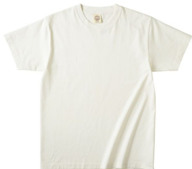
商品名 : オーガニックコットンTシャツ OGB-910

URL : https://apparel.raksul.com/brands/orgabits